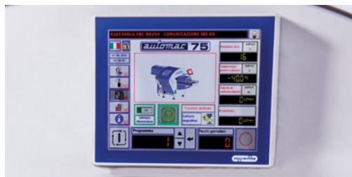
Touchscreen Monitor mit 29 editierbaren Programmen Nuovo monitor touchscreen, fino a 29 programmi modificabili New touchscreen monitor, up to 29 editable programmes