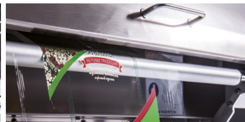
Robustheit und Sicherheit dank Edelstahlgehäusen Massima solidità e sicurezza con i carter arrotondati in acciaio inox Maximum solidity and safety with rounded stainless steel safety guards