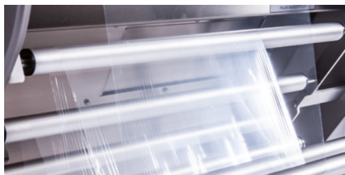
Optimiertes Abwickel- und Spannsystem der Folie Sistema ottimizzato di avvolgimento e tensionatura del film Optimised film unwinding and tensioning system